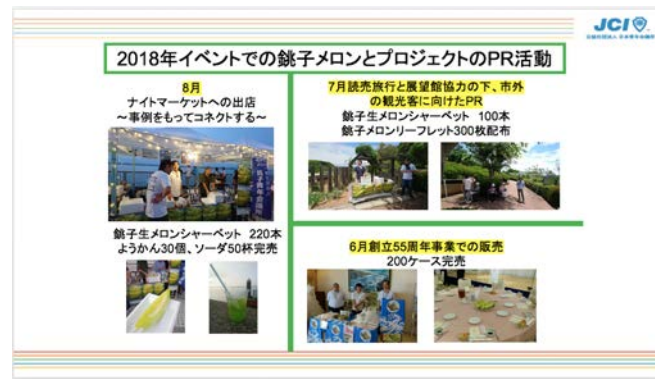
過去のイベントにて