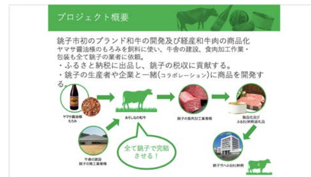
プロジェクトの概要