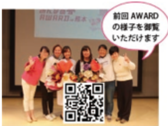
■前回AWARDのダイジェスト動画